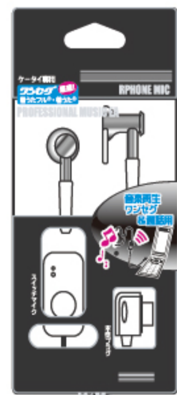
パッケージサイズ H170mm×W80mm×D25mm